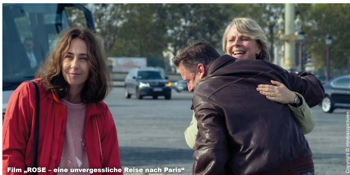
Film „ROSE – eine unvergessliche Reise nach Paris“

Weitere Informationen finden Sie im Internet unter www.bezirkskliniken-mfr.de/irre-naechte